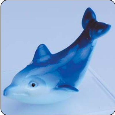
■ ポリエステル樹脂製 強度目安

強度の目安として、ヒレ部分がかたい所への落下等による衝撃が加わると破損する可能性があります。通常のご使用では簡単に折れることはありません。